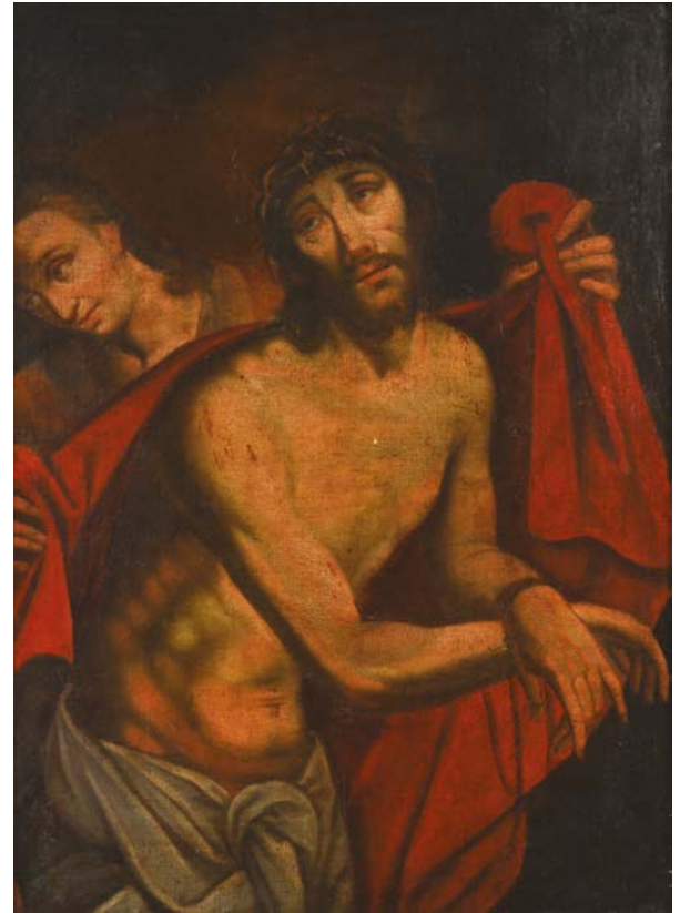
151 Le Christ aux outrages revêtu d'un manteau pourpre (Jean 19. 2) Huile sur toile (Rentoilage) 68,5 x 47 cm