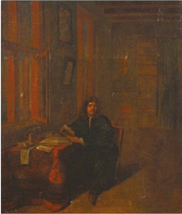
150 COQUES Gonzales (Anvers 1614-1684) (Attribué à) Portrait d'homme, livre en main, dans son intérieur Huile sur toile (ancien vernis encrassé et jauni) Au revers sur la traverse du châssis une ancienne étiquette avec une annotation manuscrite « Gonzales Coques ». 53 x 45 cm.